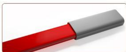
2 Греющий кабель GRX2 CR